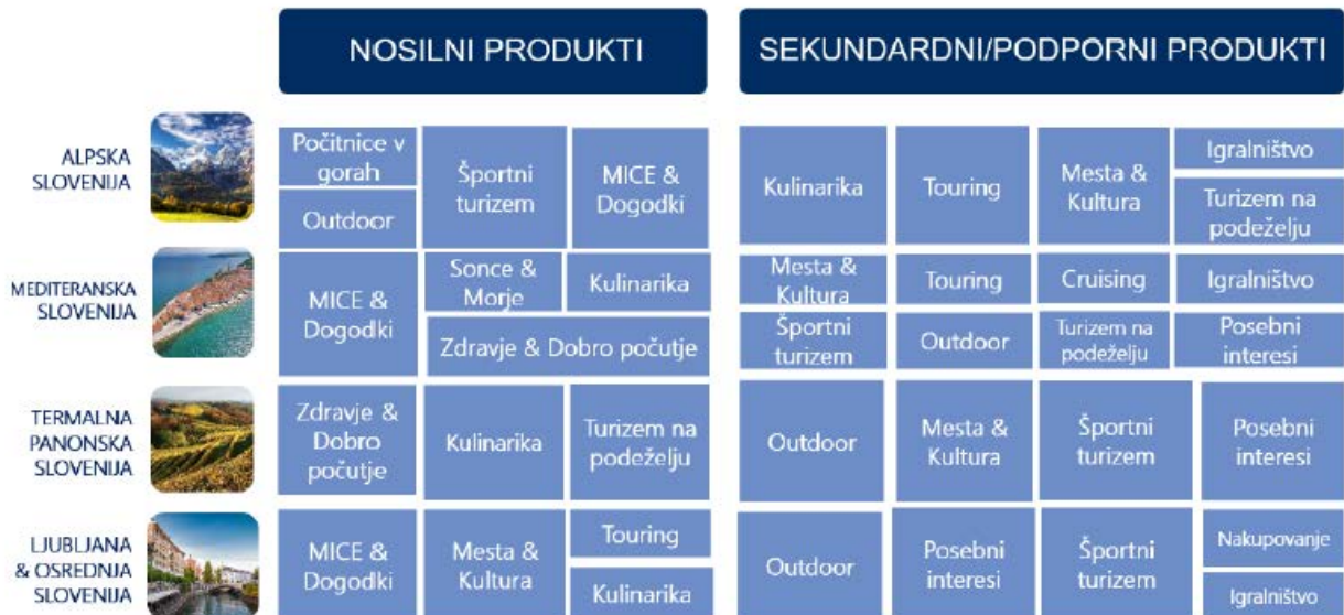
Slika 1: Prikaz nosilnih in sekundarnih/podpornih produktov po makro destinacijah

Na nacionalni ravni je identificiranih deset vodilnih (primarnih) turističnih produktov, ki so opredeljeni kot vodilni v posameznih izkustvenih makro destinacijah. To so: Počitnice v gorah, MICE & Dogodki, Zdravje & Dobro počutje, Sonce & Morje, Mesta & Kultura, Outdoor, Kulinarika, Športni turizem, Touring in Turizem na podeželju.