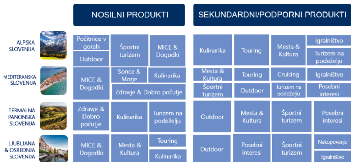
Slika 1: Prikaz nosilnih in sekundarnih/podpornih produktov po makro destinacijah

Na nacionalni ravni je identificiranih deset vodilnih (primarnih) turističnih produktov, ki so opredeljeni kot vodilni v posameznih izkustvenih makro destinacijah. To so: Počitnice v gorah, MICE & Dogodki, Zdravje & Dobro počutje, Sonce & Morje, Mesta & Kultura, Outdoor, Kulinarika, Športni turizem, Touring in Turizem na podeželju.