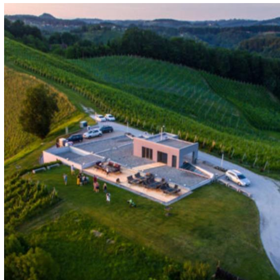
BUTIČNE VINSKE KLETI, VINOTEKE & VINSKE BARE