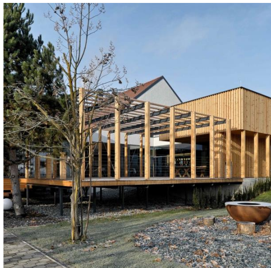
BUTIČNI GOSTINSKI LOKALI