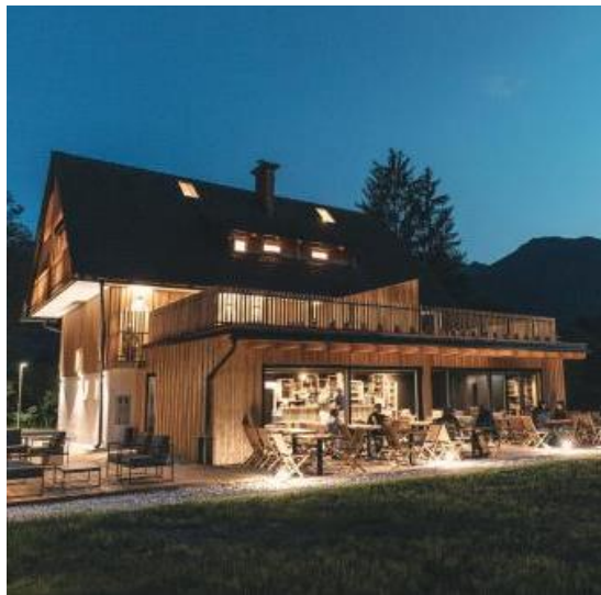
HOTELI & DRUGE NASTANITVE